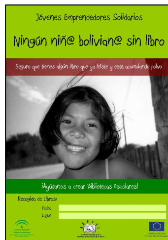
Cartel para la campaña de recogida de libros