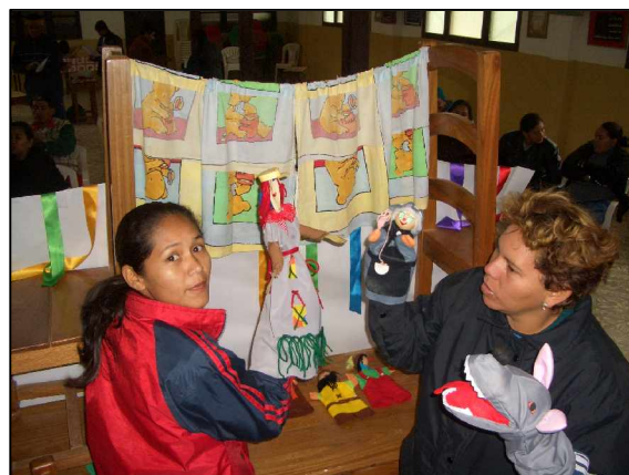
Profesoras en el taller ¿Jugamos?

Por sexto año consecutivo, AEPECT ha desarrollado sus actividades de Acción Solidaria que, encuadradas dentro del Plan La Educación, Puerta del Desarrollo , tienen su actividad principal en Bolivia. El trabajo realizado en la formación de docentes ha sido enorme, pero también se han dotado con más libros las bibliotecas ya existentes y ayudado a la formación de otras nuevas; se han donado 40 botiquines completos para que puedan servir en caso de emergencia en otros tantos centros y, en colaboración con la Fundación Hombres Nuevos, se está equipando de material dos talleres profesionales en la región de la Chiquitanía. No obstante, y por primera vez, también ha