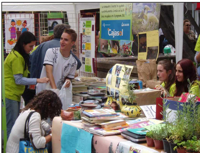
Alumnos colaboradores de AEPECT en la feria de asociaciones JES

El resultado ha sido positivo, de tal modo que está a punto de firmarse un nuevo convenio para fijar nuestra participación en el presente curso escolar, en el que el número de centros ha crecido de 6 a 11. Para este curso ya se han buscado 11 unidades educativas bolivianas entre las solicitudes que en este sentido recogieron nuestros voluntarios. Todas ellas están dispuestas a