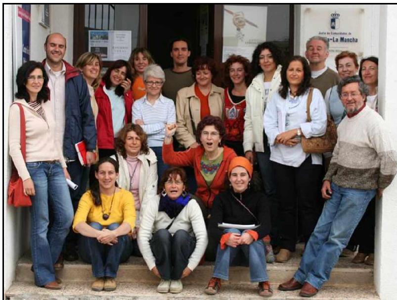
Participantes en la reunión de El Toboso

Tras la reunión se produjeron algunas bajas que tuvieron que ser cubiertas con nuevas incorporaciones. Finalmente el grupo de cooperantes en Bolivia de esta campaña 2006, fue el integrado por: