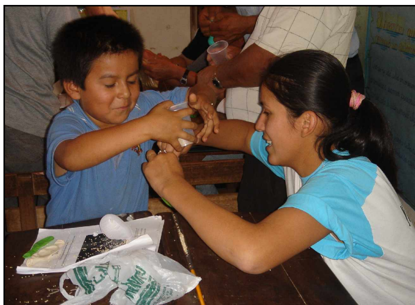
Una maestra ayudada por su hijo en uno de los cursos de Mairana

También se comentaron posibles mejoras en la fase previa anterior al viaje a Bolivia. Así por ejemplo, se acordó que para viajar a Bolivia sea requisito indispensable el haber asistido a la reunión de información previa, a la que debería ir un número mayor de personas que de plazas necesarias para cubrir las posibles bajas y que, para facilitar las relaciones entre los miembros de los grupos, se planteara una segunda reunión previa esta vez con carácter grupal.