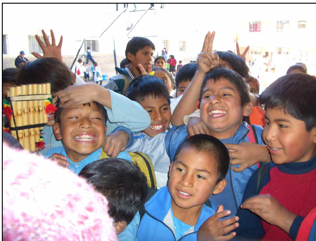
Alumnos de un colegio de Yotala