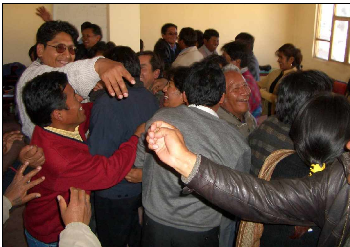
Grupo de asistentes del curso de sexualidad en Potosí