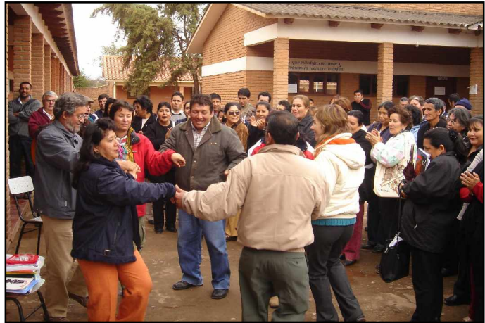
Acto festivo de clausura del curso en Mairana

El 18 % de ellos son interinos. Así se denominan allí a aquellos maestros que no tienen estudios superiores y que ocupan un puesto de maestro porque no hay suficientes normalistas (titulados en magisterio). Al no tener formación pedagógica, ellos son el objetivo principal de nuestra actuación. En localidades como Concepción o Pailón, el número de interinos superaba al de resto de asistentes.