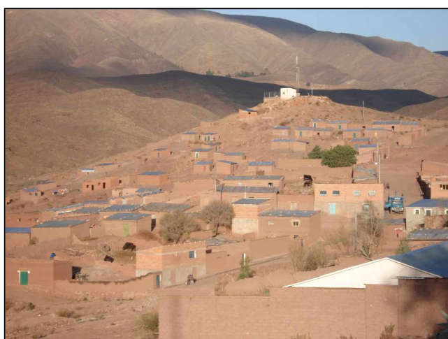
El pueblo de Pocoata

Prácticamente cuando ya había concluido la actividad de los tres primeros grupos, el cuarto, el de Potosí Norte, aterrizaba en Bolivia dispuesto a trabajar todo el mes de agosto. Su recorrido era el más complejo de los cuatro por tres razones: era el que iba a localidades con mayor índice de pobreza, con mayor implantación del quechua y a mayor altura. Su recorrido fue Potosí (donde se integraron también Carme, Sebas y Malena), Betanzos, Colquechaca y Pocoata, y terminaron tan ajustados de tiempo, que algún cooperante tuvo problemas para coger el vuelo de vuelta a España a tiempo para empezar sus clases.